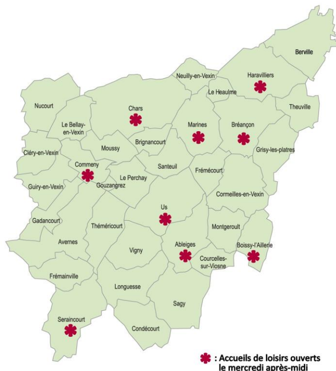
* : Accueils de loisirs ouverts le mercredi après-midi

↳ La sectorisation des accueils des centres de loisirs n'est valable que les mercredis après-midi au titre de la réforme des rythmes scolaires.