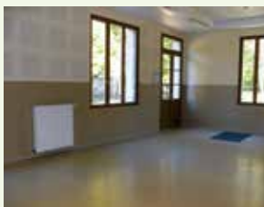
→ Salle Frêne : 40 personnes

Au rez-de-chaussée, 3 salles indépendantes, d'une capacité de réception globale maximale de 100 personnes pour des activités de loisir et détente, ateliers, expositions, réunions et manifestations, ou 80 personnes en restauration, avec les possibilités d'accueil suivantes :