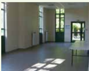
→ Salle Marronnier : 70 personnes

Tables et chaises à disposition pour 100 personnes uniquement.