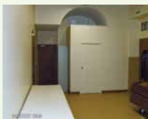
Salle Noisetier : ← 30 personnes